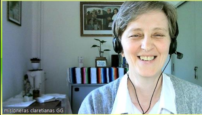
misioneras claretianas GG